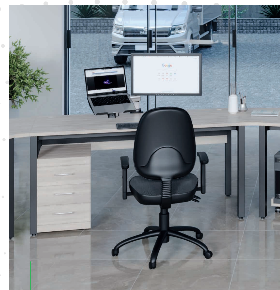
Suporte de Notebook

Para projetos ou operações que buscam mais do que apenas móveis de escritório, nossa Linha EB conta com uma estrutura organizada para telas, equipamentos e cabos, proporcionando funcionalidade sem renunciar à qualidade.