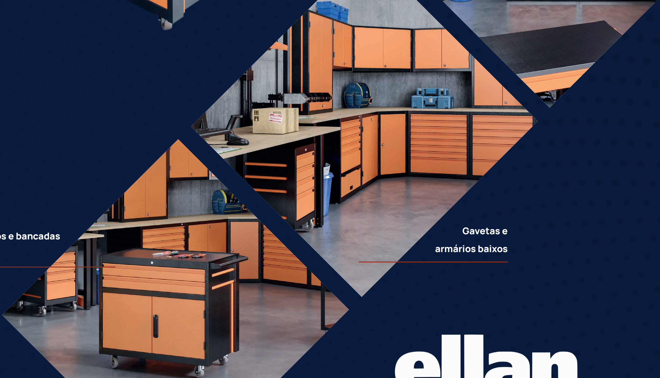
Carrinhos e bancadas móveis