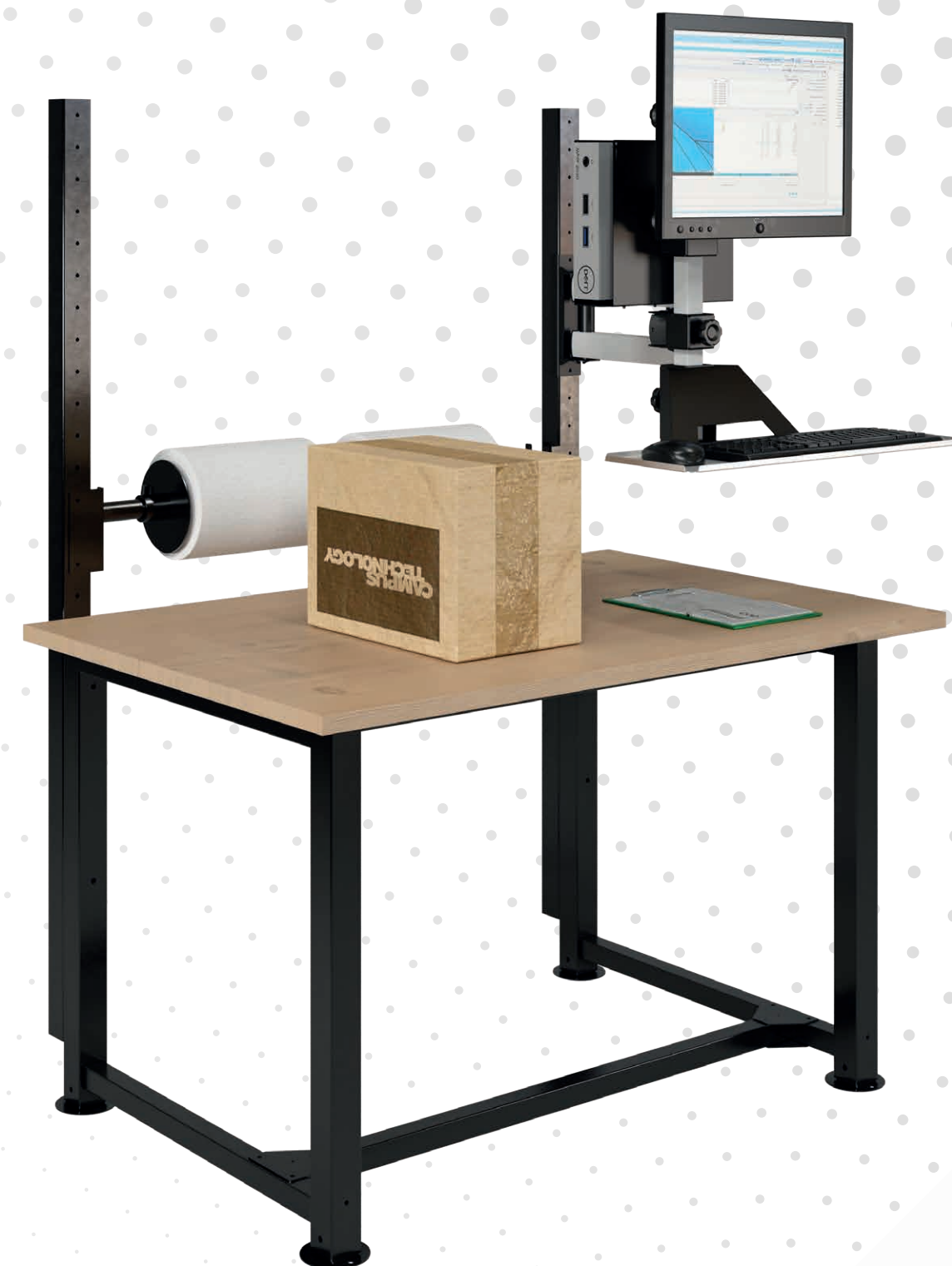
Ajuste de altura manual com parafusos

Descubra o equilíbrio perfeito entre custo e qualidade com nossa linha de bancadas básicas. Leves e versáteis, essas bancadas oferecem flexibilidade na montagem de acessórios e ajuste de altura manual através dos parafusos dos pés. Priorizando organização, ergonomia e produtividade, são a solução ideal para sua operação.