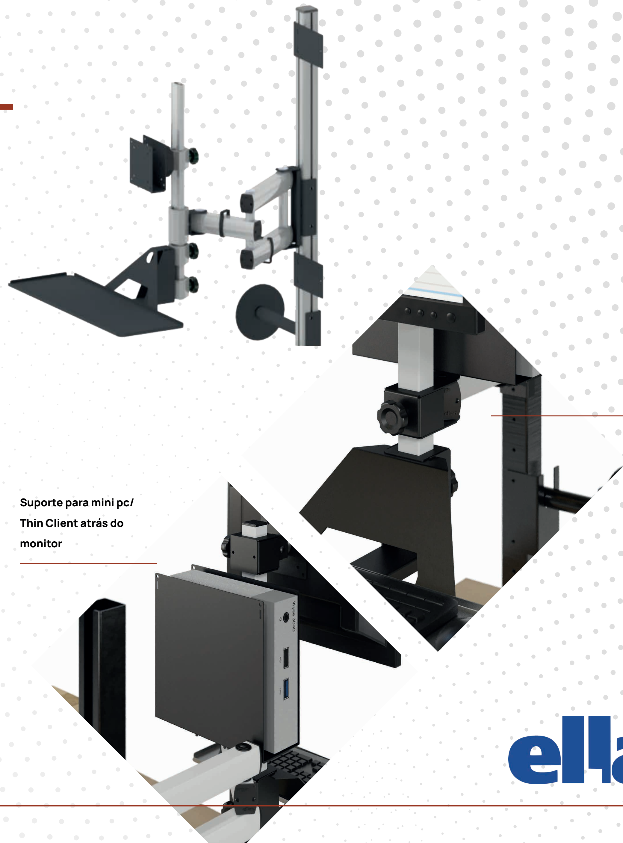
Suporte para mini pc/ Thin Client atrás do monitor